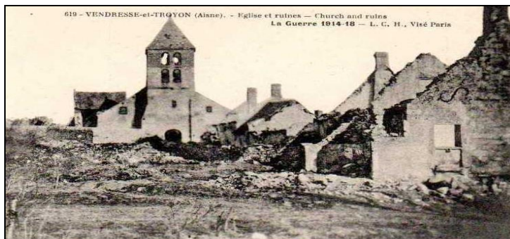
Le village de Vendresse (Aisne)