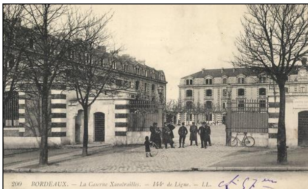
Bordeaux, la caserne Xaintraillies du 144 ème Régiment d'Infanterie.