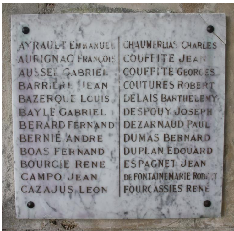
Monument aux Morts de la commune de Loupiac (Gironde)