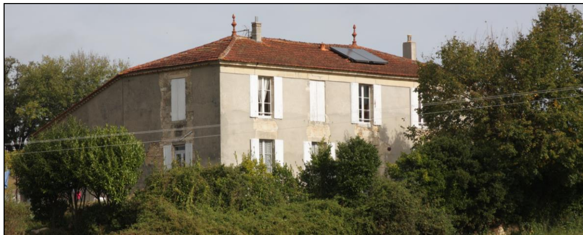
Le lieu dit Malendure, lieu de résidence des familles Fourcassies.