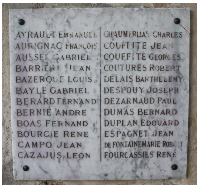
Monument aux Morts de la commune de Loupiac (Gironde)