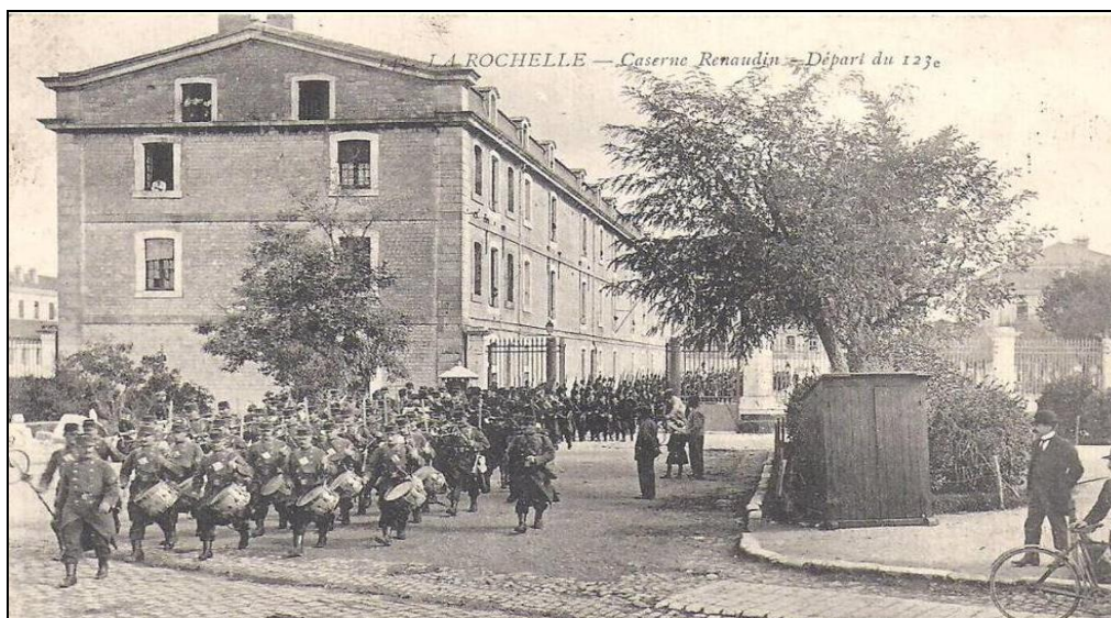
La Rochelle, la caserne Renaudin du 123 ème Régiment d'Infanterie.