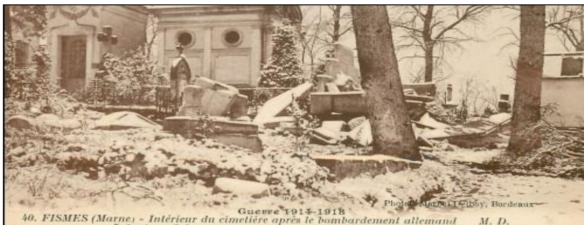
40. FISMES (Marne) - Intérieur du cimetière après le bombardement allemand M. D. Guerre 1914-1918