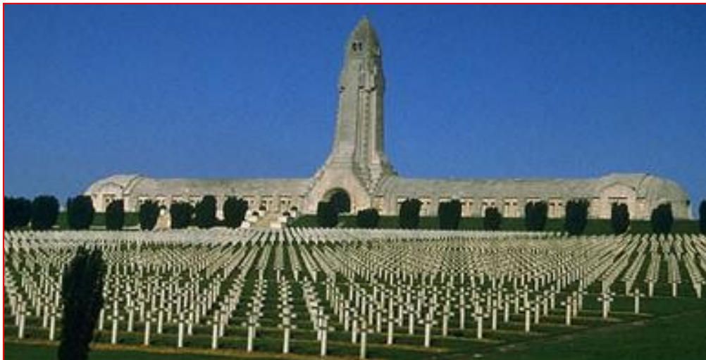
Nécropole nationale de Fleury devant Douaumont « La Douaumont »

Lieu de sépulture : Fleury – devant - Douaumont (55 - Meuse, France) Nom du site de sépulture : Nécropole nationale 'Douaumont' Type de sépulture : Tombe individuelle Numéro de la sépulture : 6561