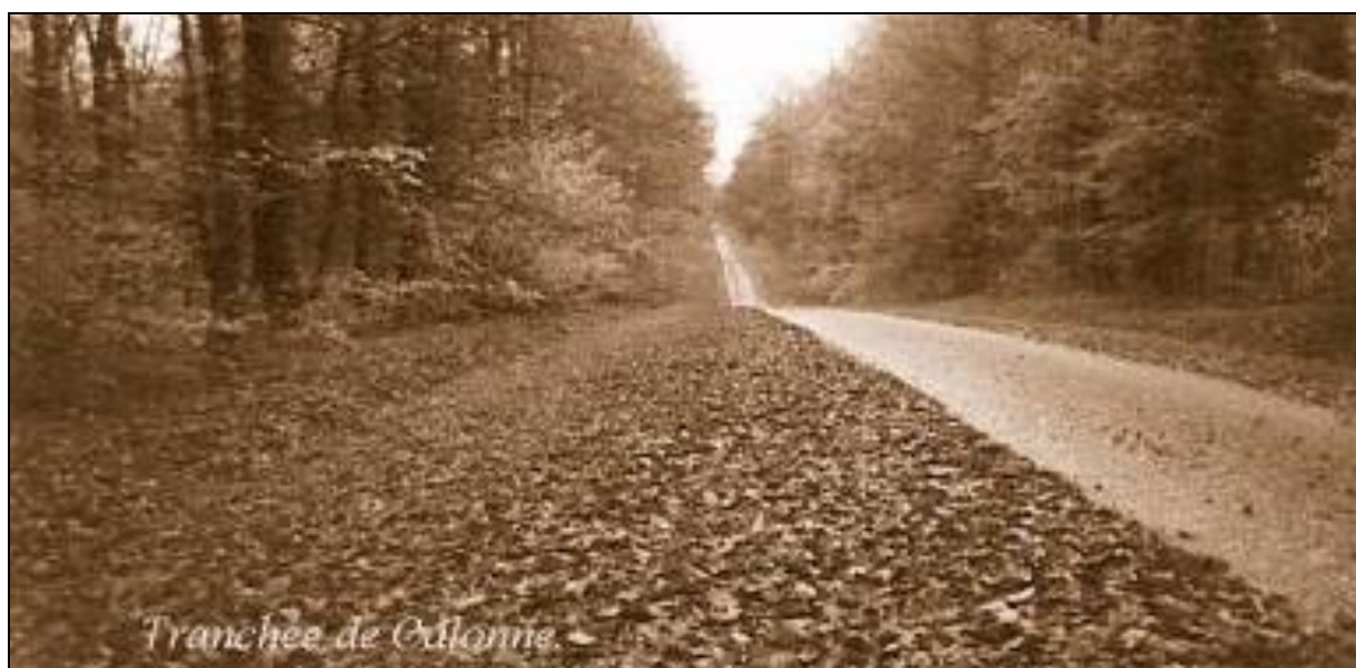
Tranchée de Calonne (Meuse)