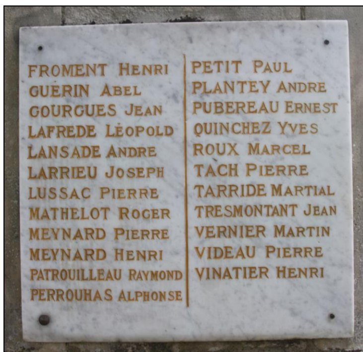
Monument aux Morts de la commune de Loupiac (Gironde)