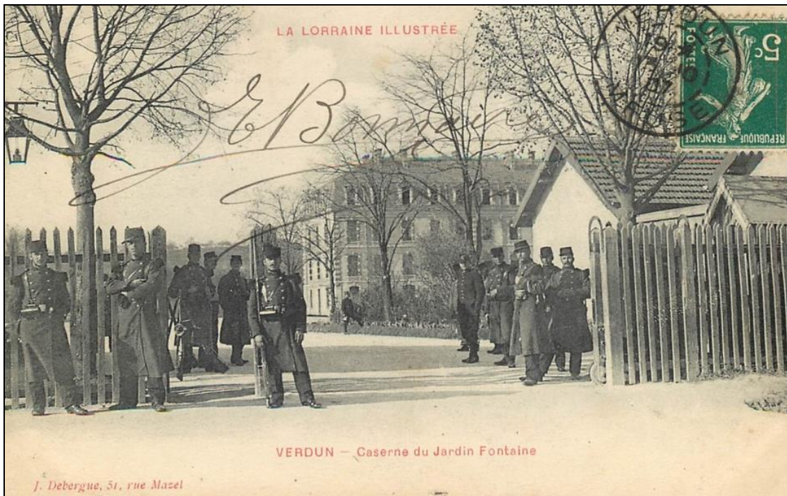
Verdun, caserne du Jardin Fontaine du 366 ème Régiment d'Infanterie.